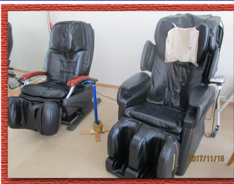
マッサージチェア