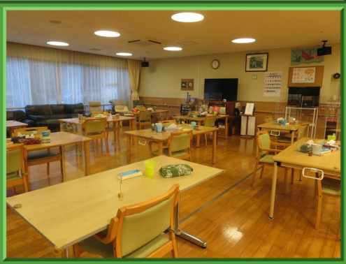
少人数でアットホームです